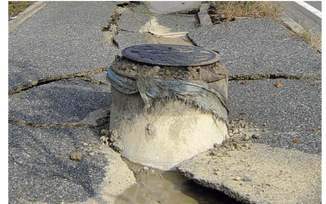
▲液状化現象で浮き上がったマンホール