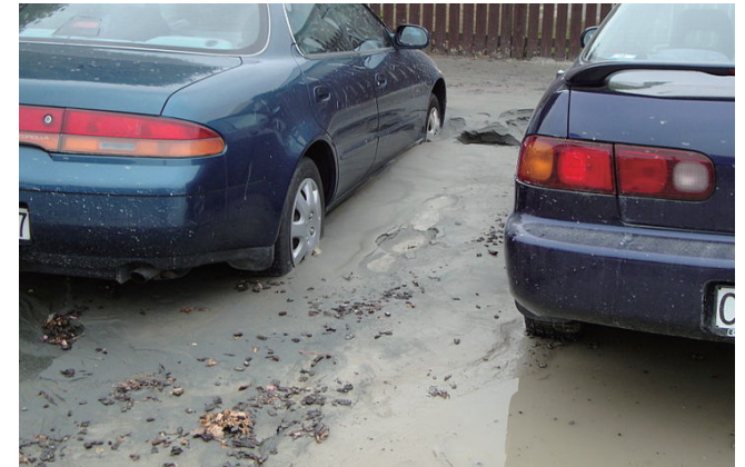
▲液状化現象で沈んだ車