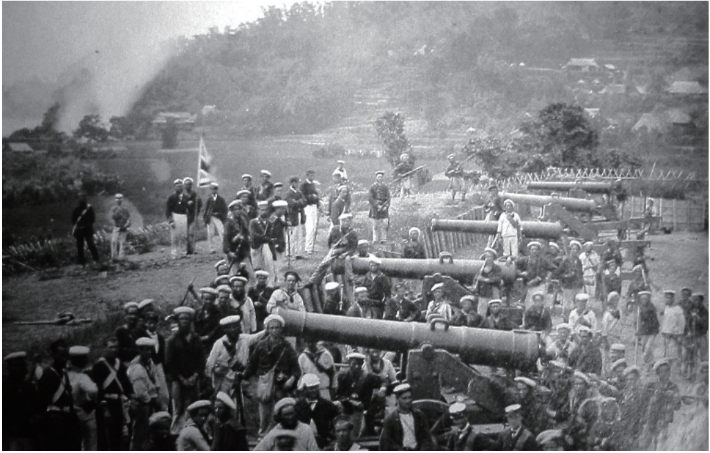
◀ 下関砲台を占領する外国軍