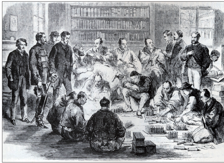
▲ 生麦事件の賠償金を支払う薩摩藩