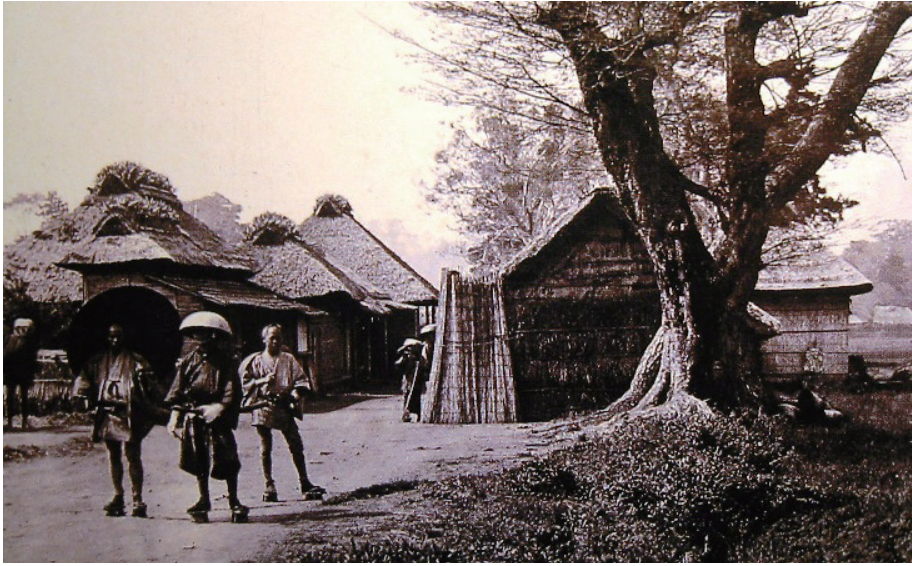
▲ 生麦村 (1862)