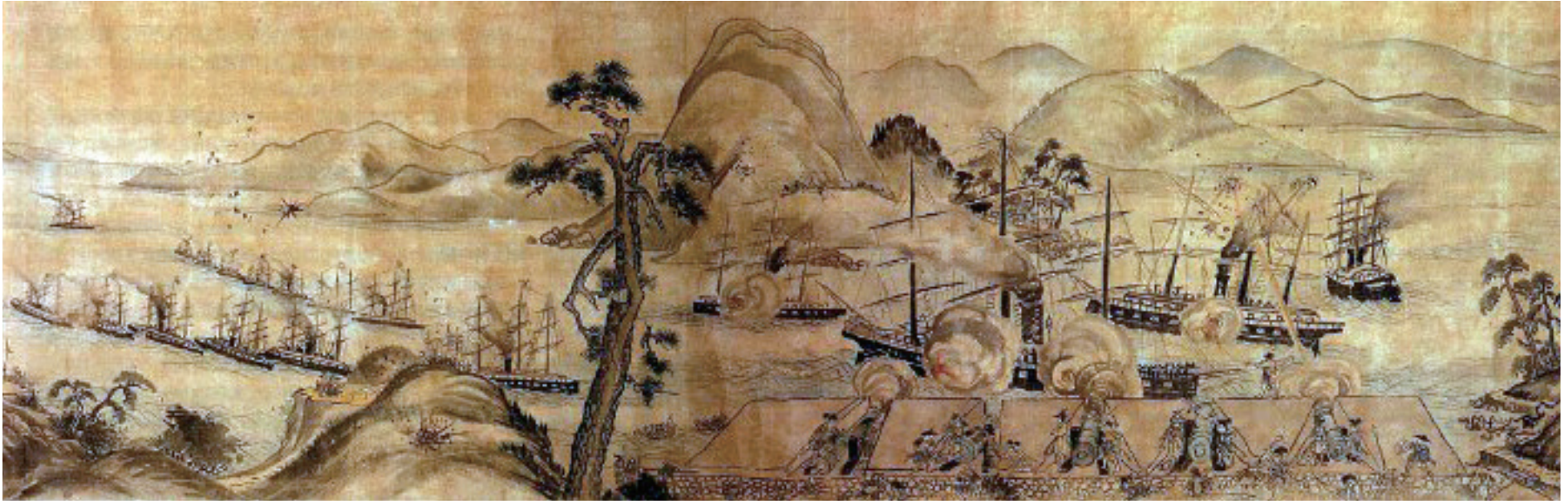
◀ 外国軍と戦う長州藩