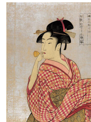
▲ポッピンを吹く女