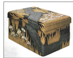
▲八橋蒔絵螺鈿硯箱