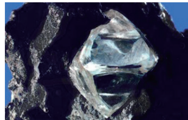
▲ダイヤモンドの結晶