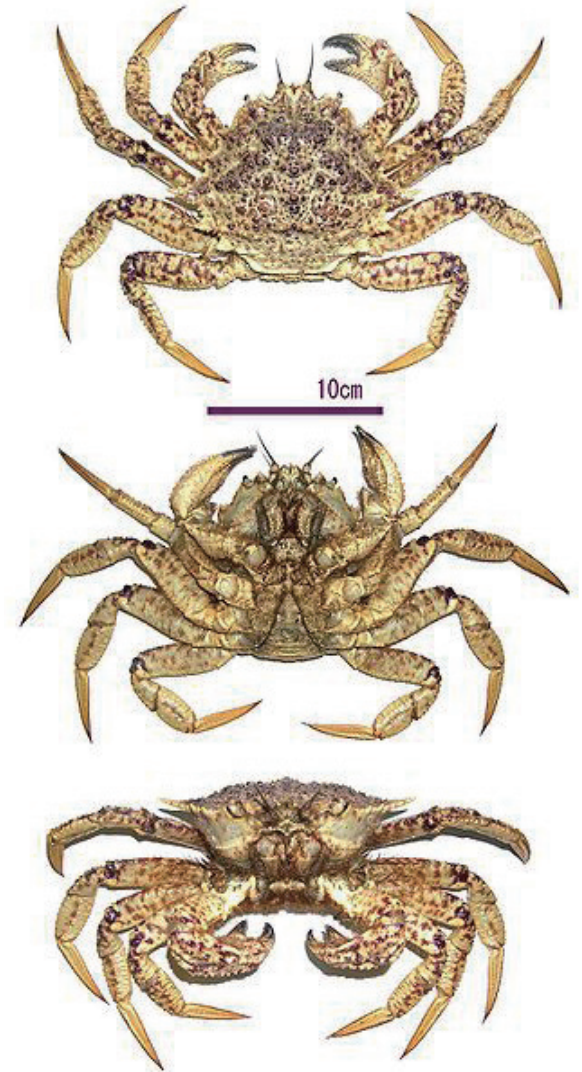
▲カニの色々な角度のイラスト

節足動物は体内に骨は無いが、 体の外側は殻におおわれている。 ⇒体を支えたり、保護する働きをする。 ⇒この体の外側の殻を 外骨格 という。 ※体を動かす時は外骨格とその内側の筋肉を使 う。